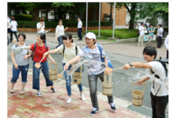
打ち水で涼しく大作戦