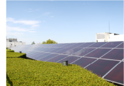
1号館屋上 太陽光発電設備