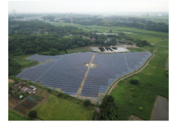
メガソーラー野田発電所